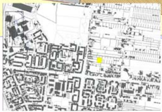
plan incadrare in zona