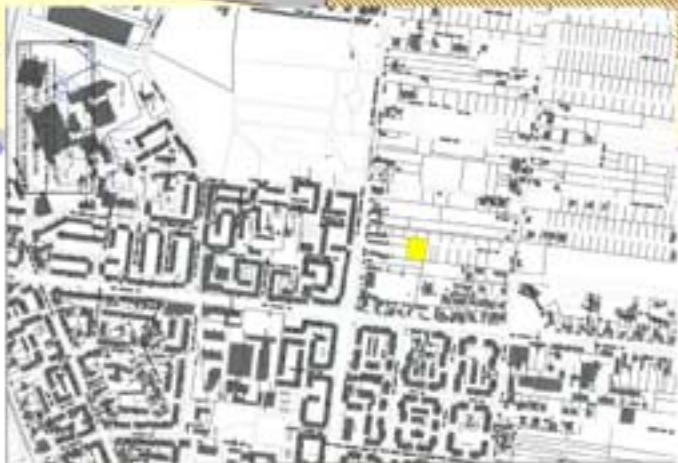
plan incadrare in zona