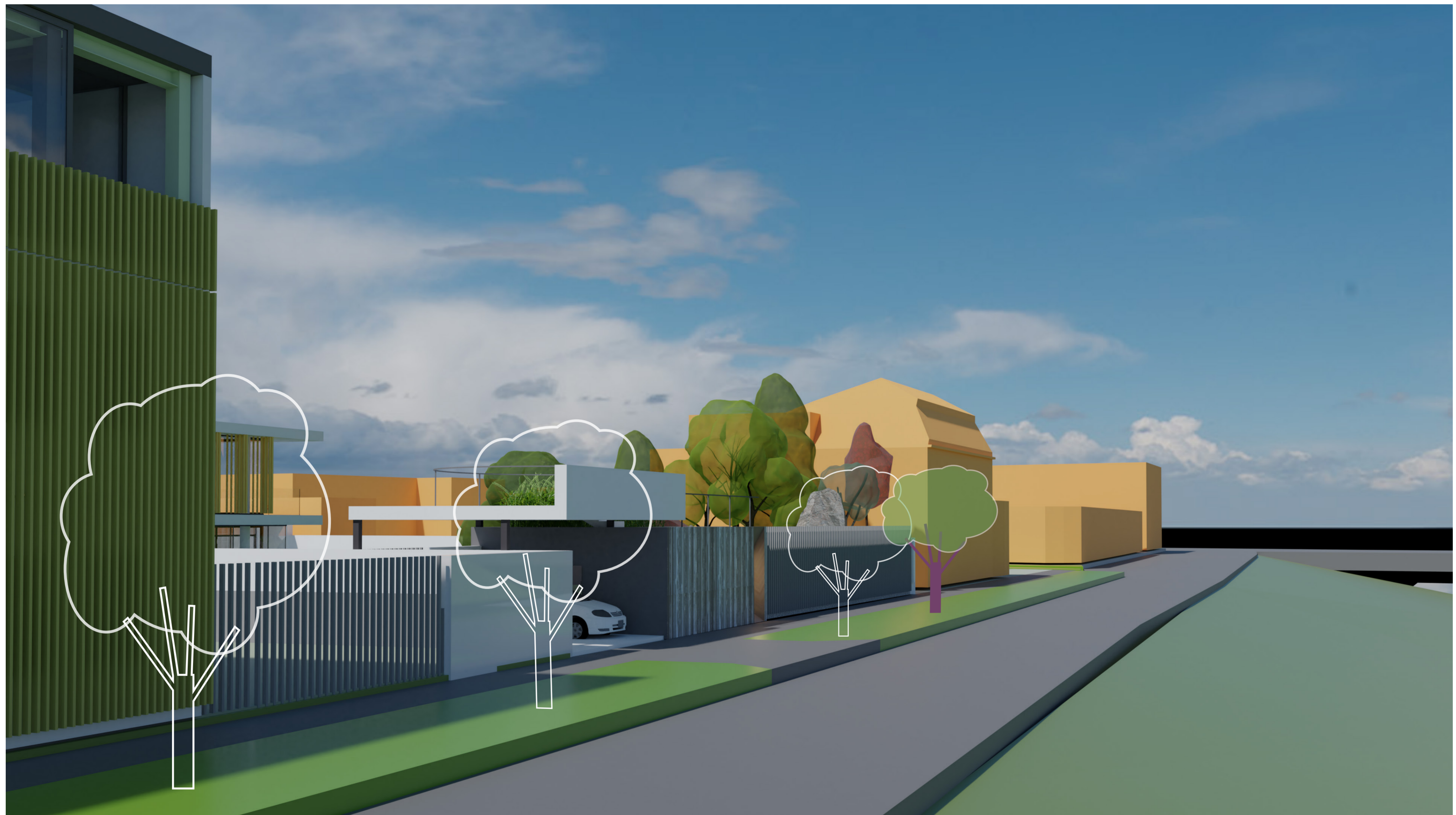
STRATURI și STRUCTURI RITMICE