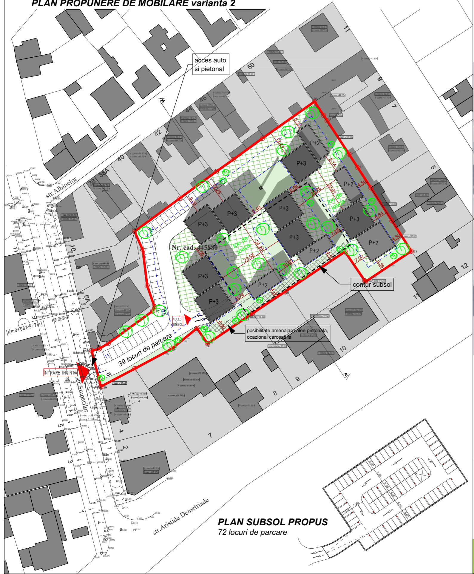
PLAN SUBSOL PROPOS 72 locuri de parcare