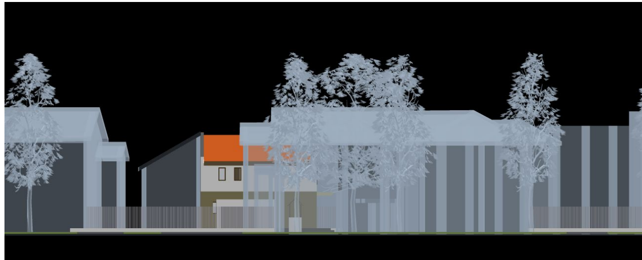
vedere A de pe strada Rusu Șireanu