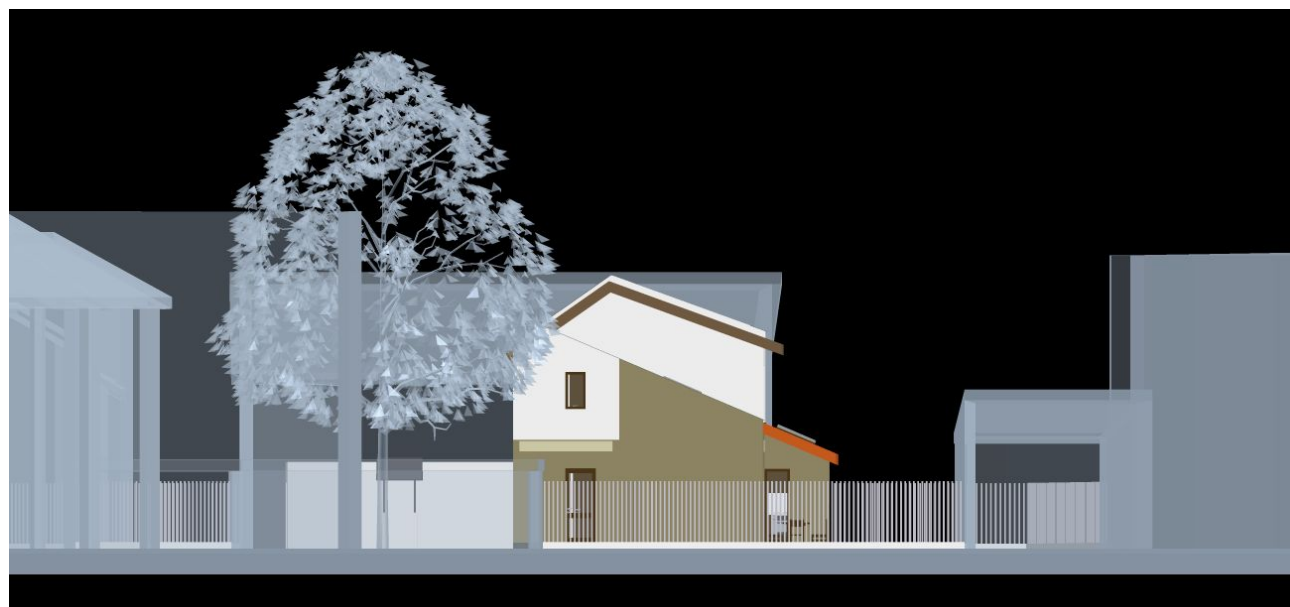
vedere C , fațadă laterală vest