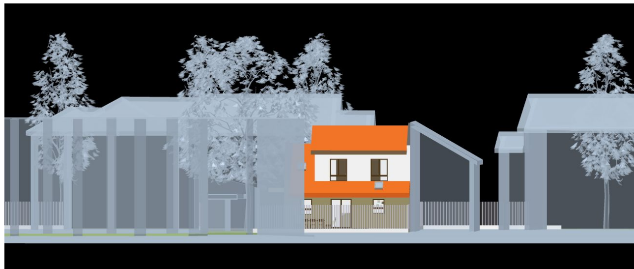
vedere B , fațadă sud