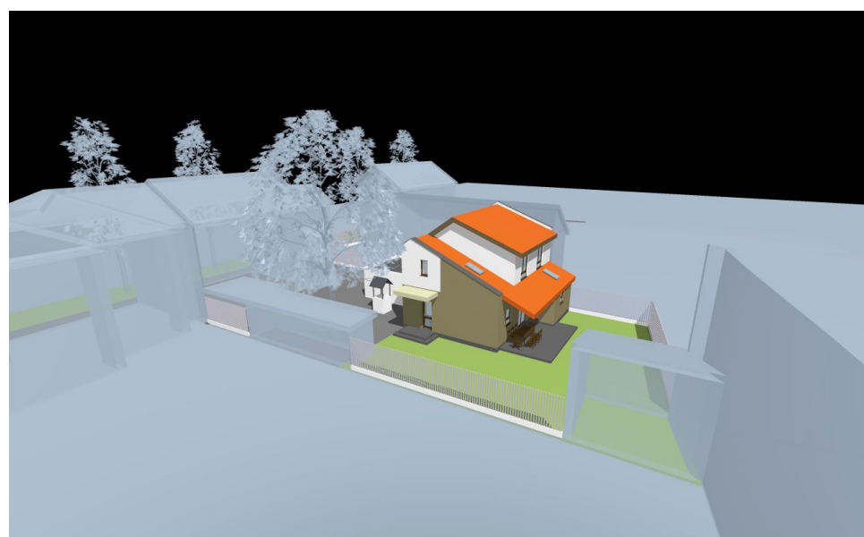
vedere de ansamblu cu propunerea poziționării noii clădiri