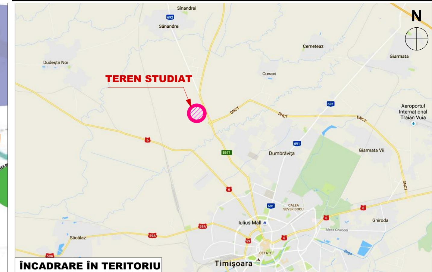
ÎNCADRARE ÎN TERITORIU