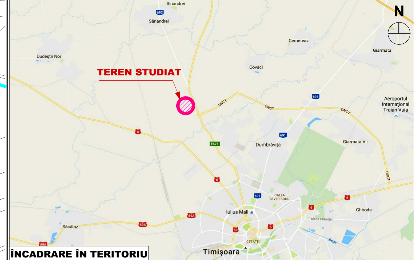
ÎNCADRARE ÎN TERITORIU