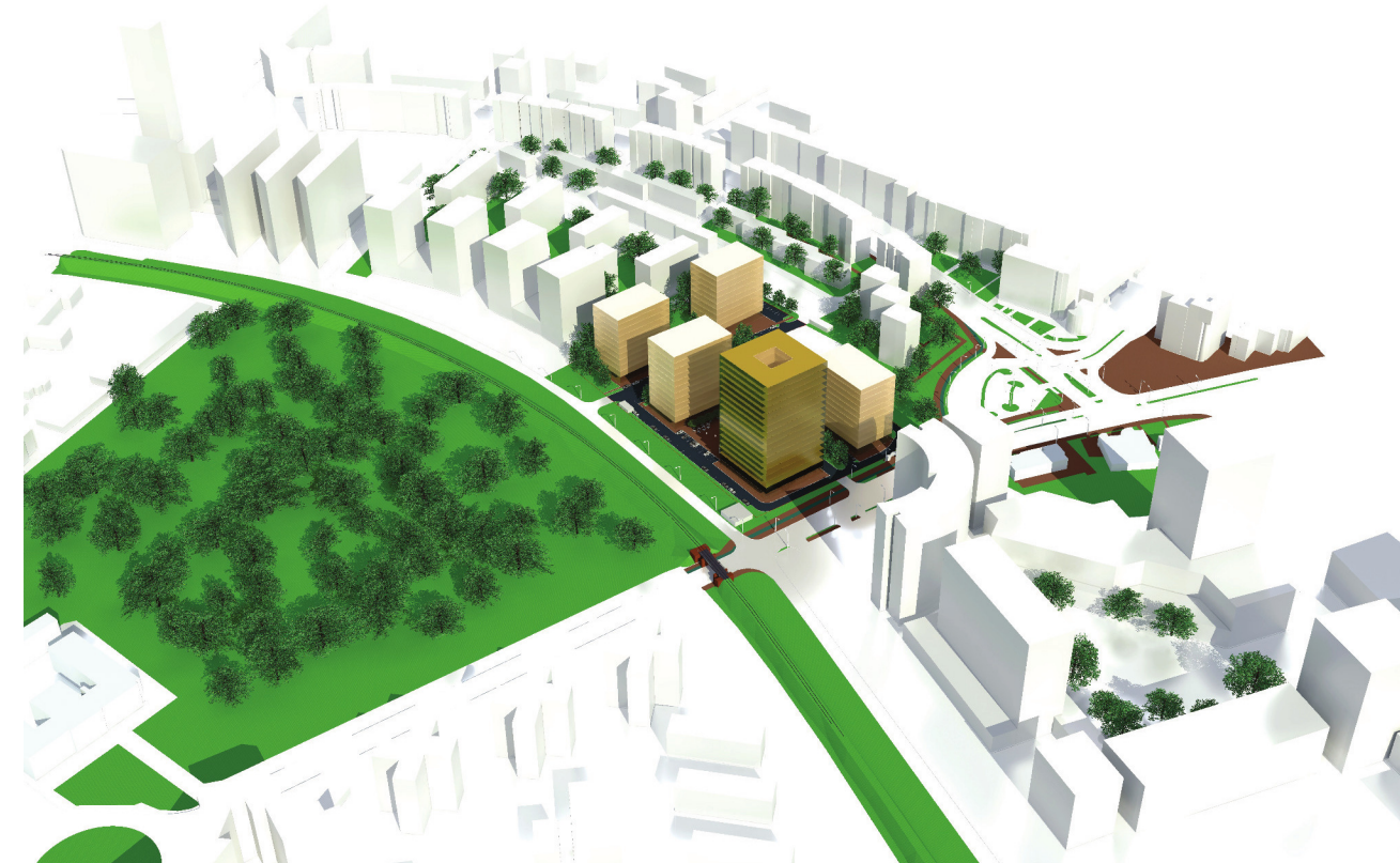
VOLUMETRIE STR. PICTOR ION ZAICU, PARC BOTANIC