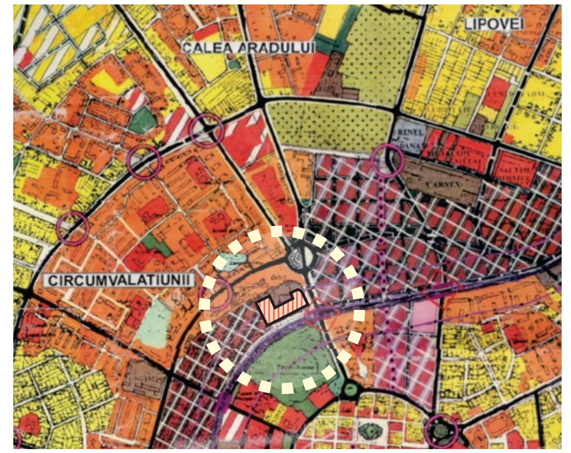
EXTRAS DIN PUG TIMISOARA