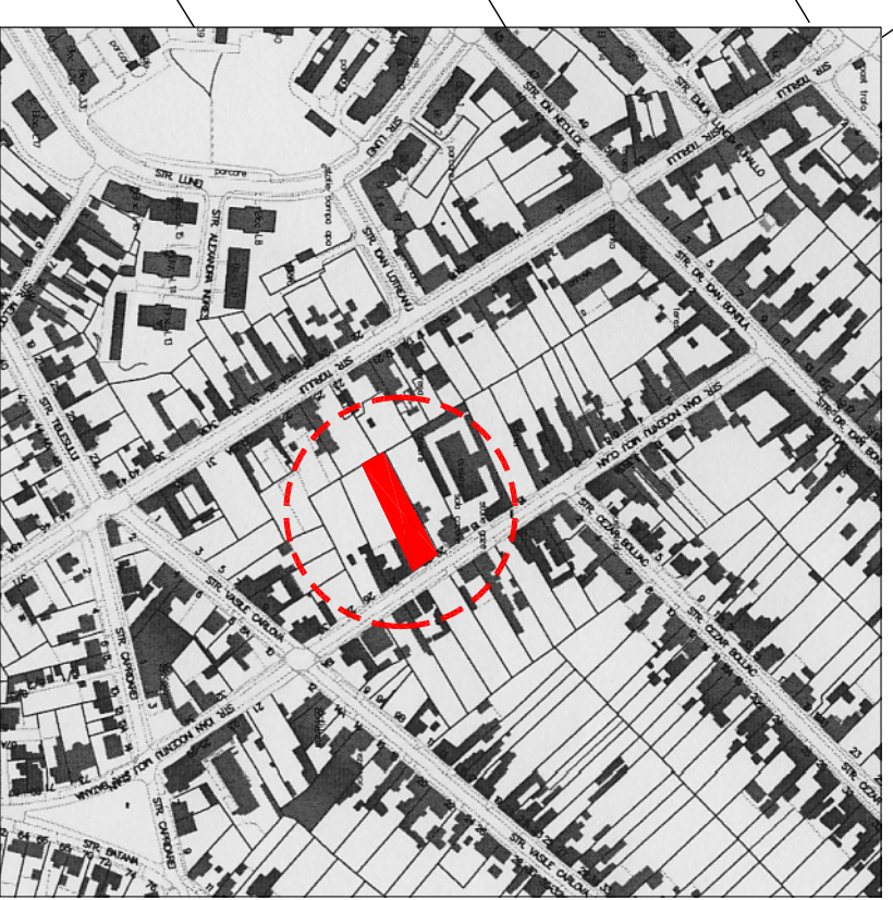
PLAN DE INCADRARE IN LOCALITATE 1:5000