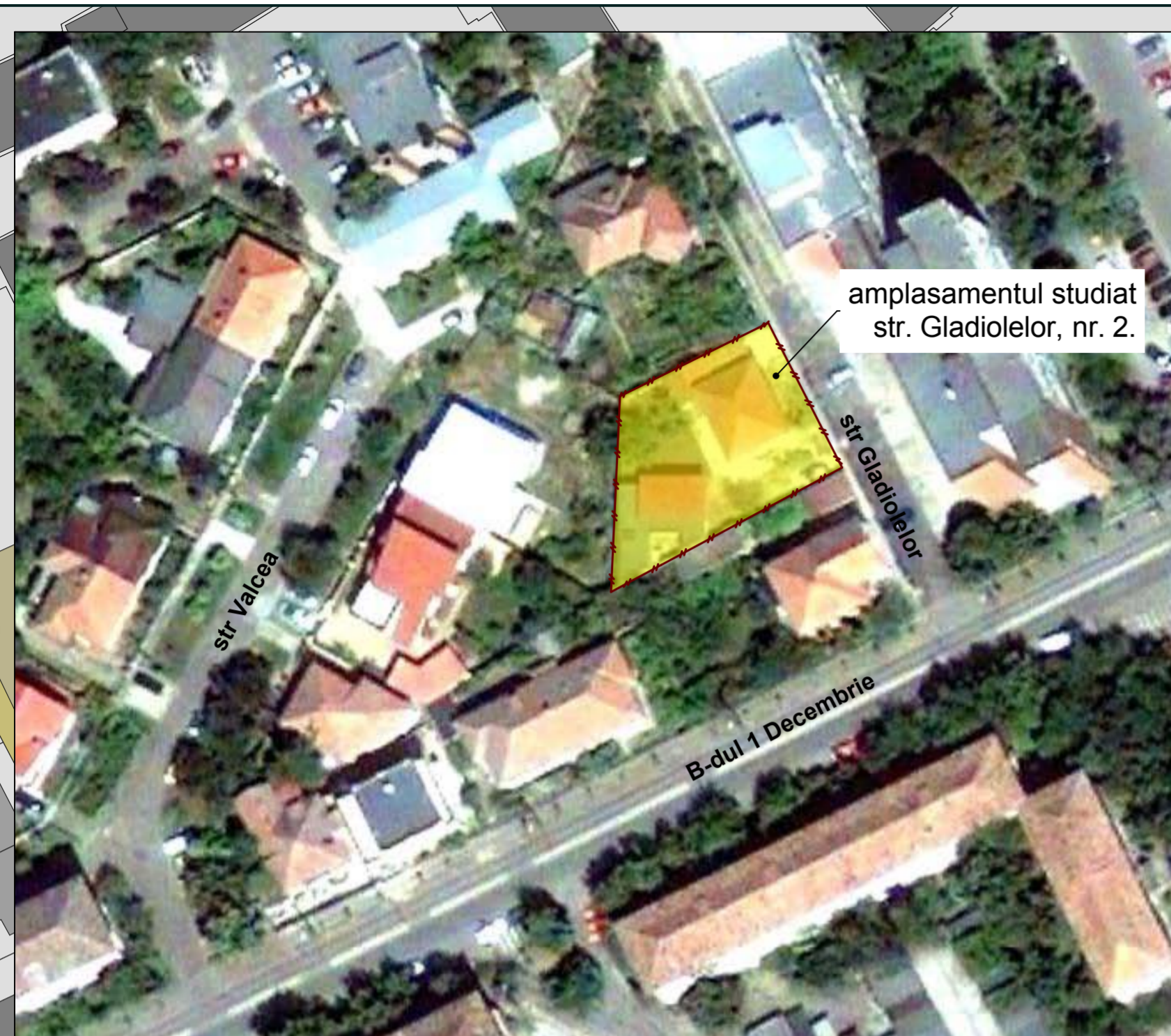
PLAN DE INCADRARE - VEDERE AERIANA