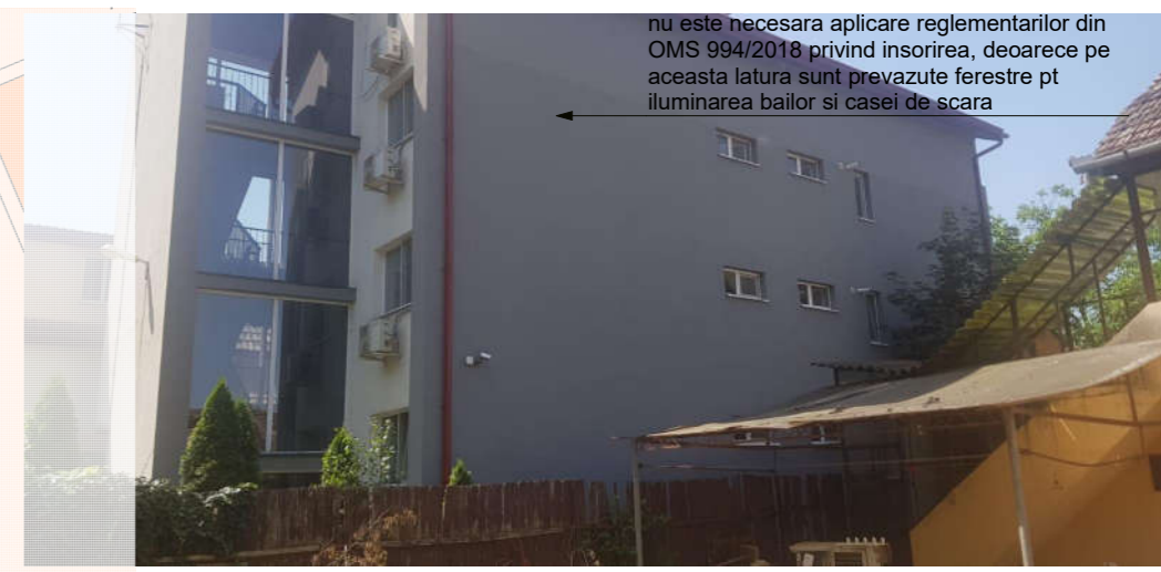
nu este necesara aplicare reglementarilor din OMS 994/2018 privind insorirea, deoarece pe aceasta latura sunt prevazute ferestre pt iluminarea bailor si casei de scara