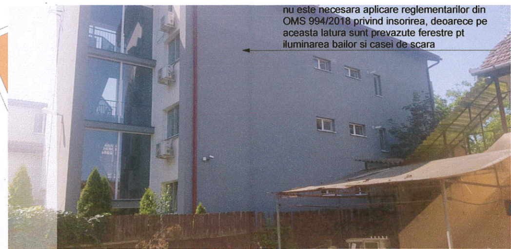
nu este necesara aplicare reglementarilor din OMS 994/2018 privind insorirea, deoarece pe aceasta latura sunt prevazute ferestre pt iluminarea baiilor si casei de scara