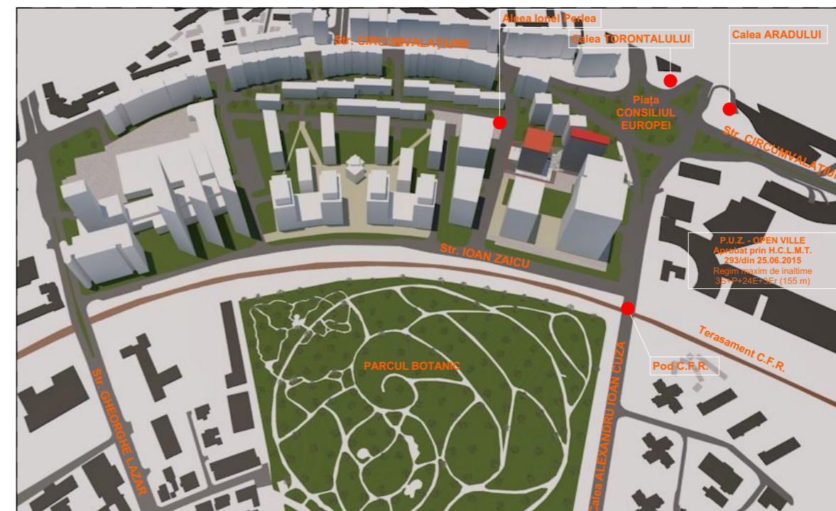
PERSPECTIVĂ DE ANSAMBLU