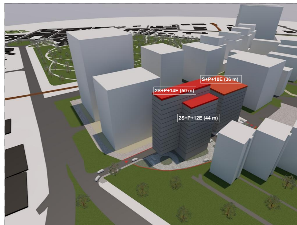
PERSPECTIVĂ DINSPRE PȚA. CONSILIUL EUROPEI