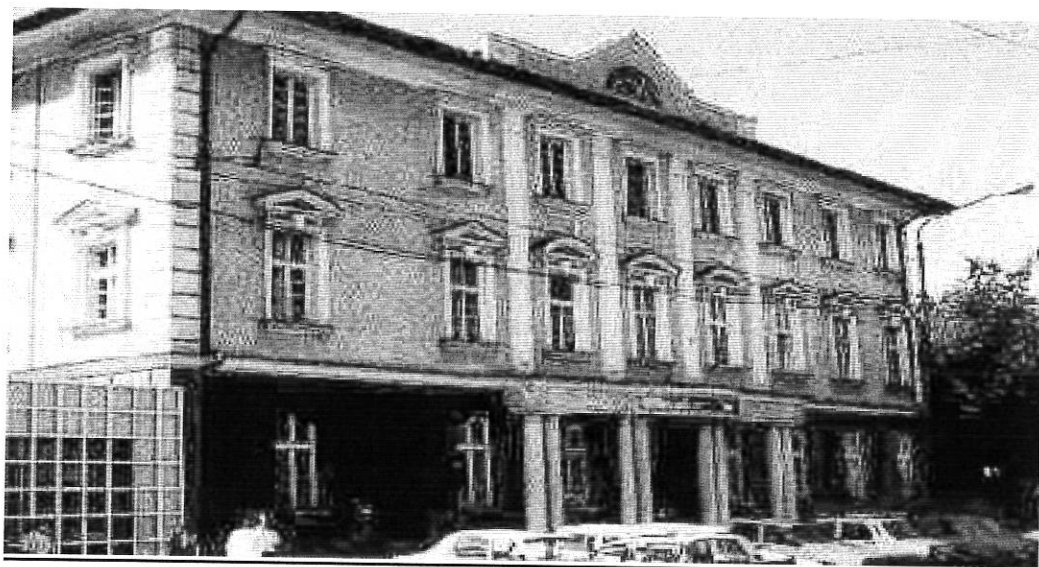
Sediu central: B-dul. Take Ionescu nr. 56, cod 300074, Timișoara, jud. Timiș. Vedere asupra sediului central.