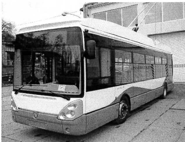
Tipuri de troleibuze aflate în dotarea Regiei Autonome de Transport Timișoara