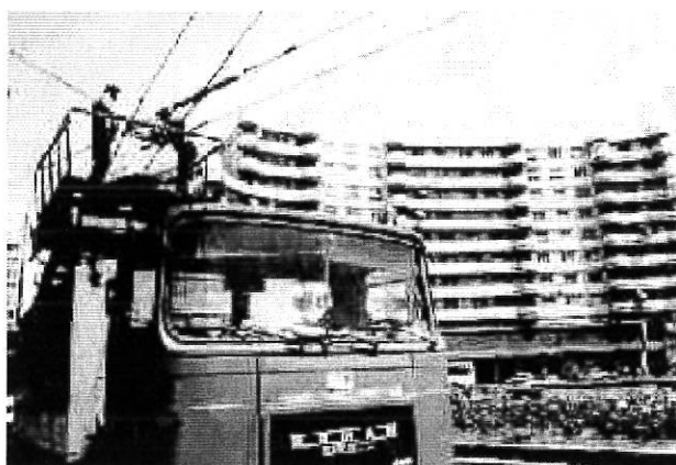
Tipuri de autoutilitare aflate în dotarea Regiei Autonome de Transport Timișoara