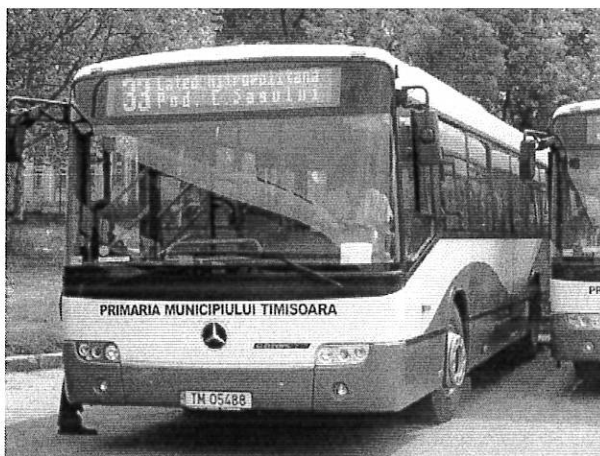
Tipuri de autobuze aflate în dotarea Regiei Autonome de Transport Timișoara