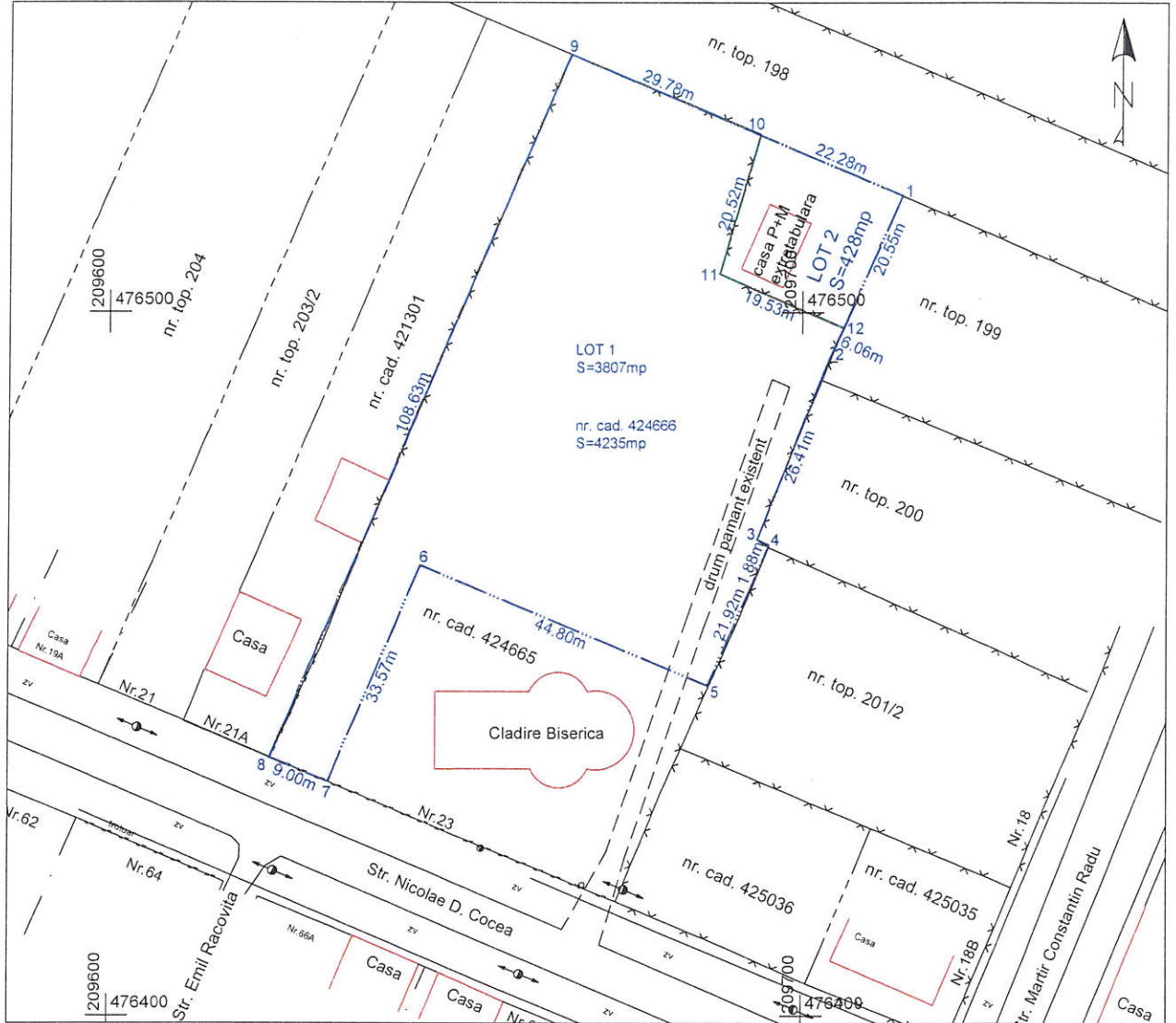
Tabel de miscare parcelara pentru dezlipire imobil