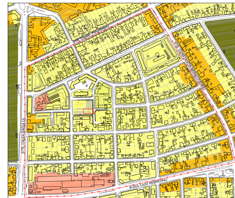
Extras din PUG-ul nou (conform Regulamentului Local aferent "Propunerilor preliminare ce vor fi supuse spre avizare- Etapa a 3-a elaborare PUG Timisoara" aprobate prin HCL nr. 428/2013)