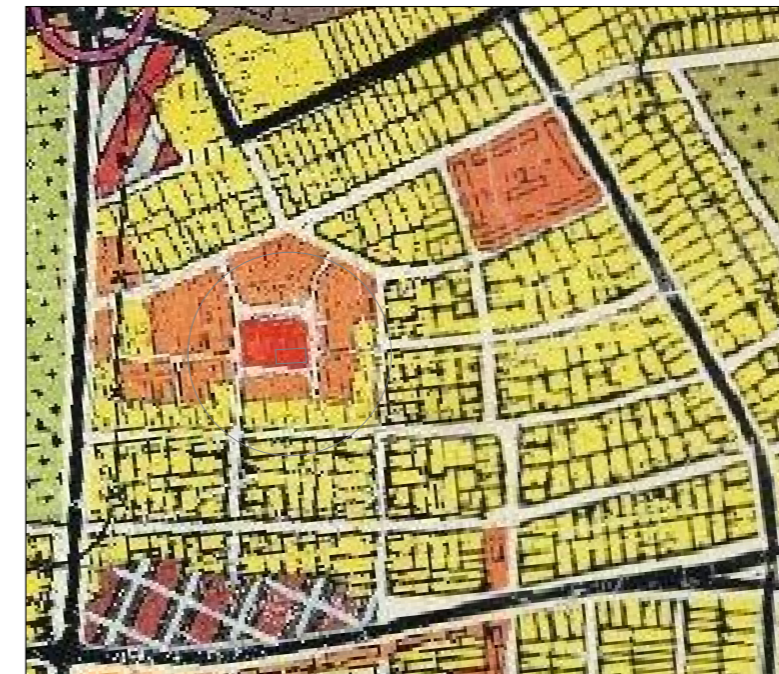
Extras din PUG apobat prin HCL 157/2002 prelungit prin HCL 139/2007, HCL 105/2012, HCL 107/2014, HCL 131/2017