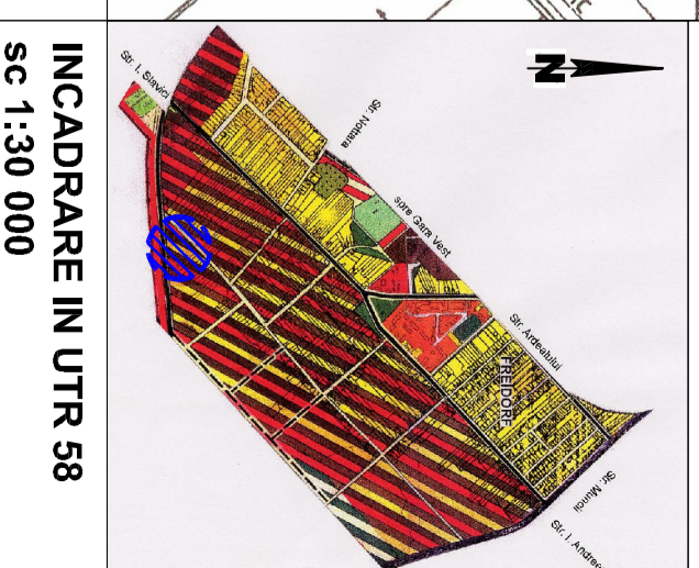
INCADRARE IN UTR 58 sc 1:30 000

NR. TOP. 647/2/2 - C.F. 424 307. S = 500,00 mp NR. TOP. 647/2/1 - C.F. 424 308. S = 7 880,00 mp NR. TOP. 649/A/1/3/2 - C.F. 424 335. S = 650,00 mp Suprafata teren = 9 000,00 mp Proprietar: Dumitru Ioan Barbu/Dumitru si soția Dumitru Voichita