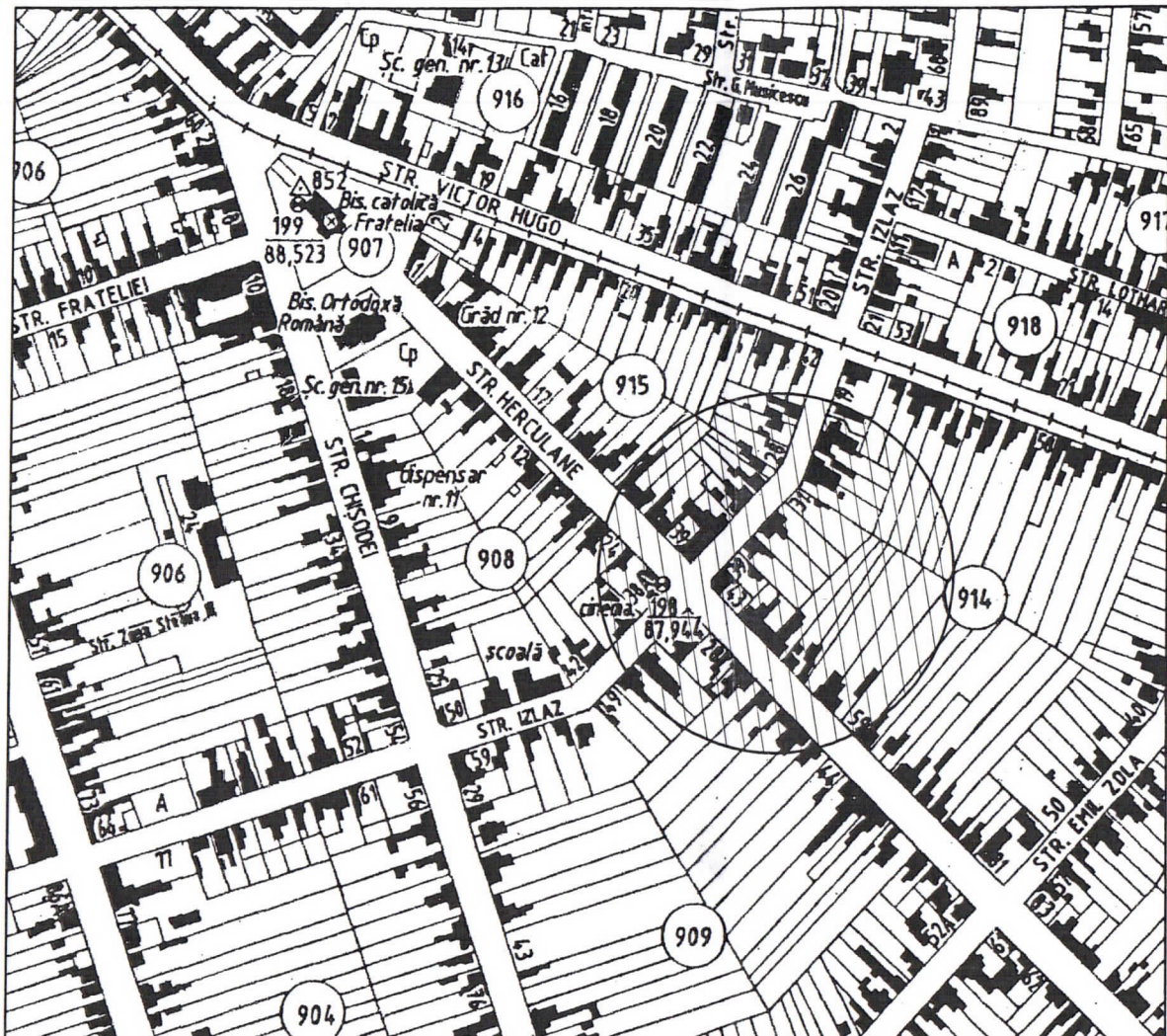
Plan de incadrare in zona Scara - 1 : 5000