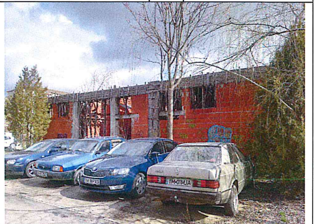
Fatada laterala stanga