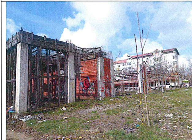
Fatada laterala dreapta