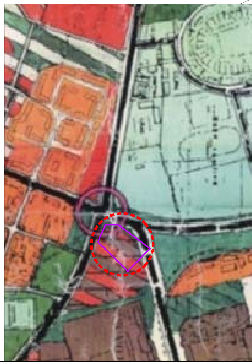
EXTRAS PUG TIMISOARA 1:5000