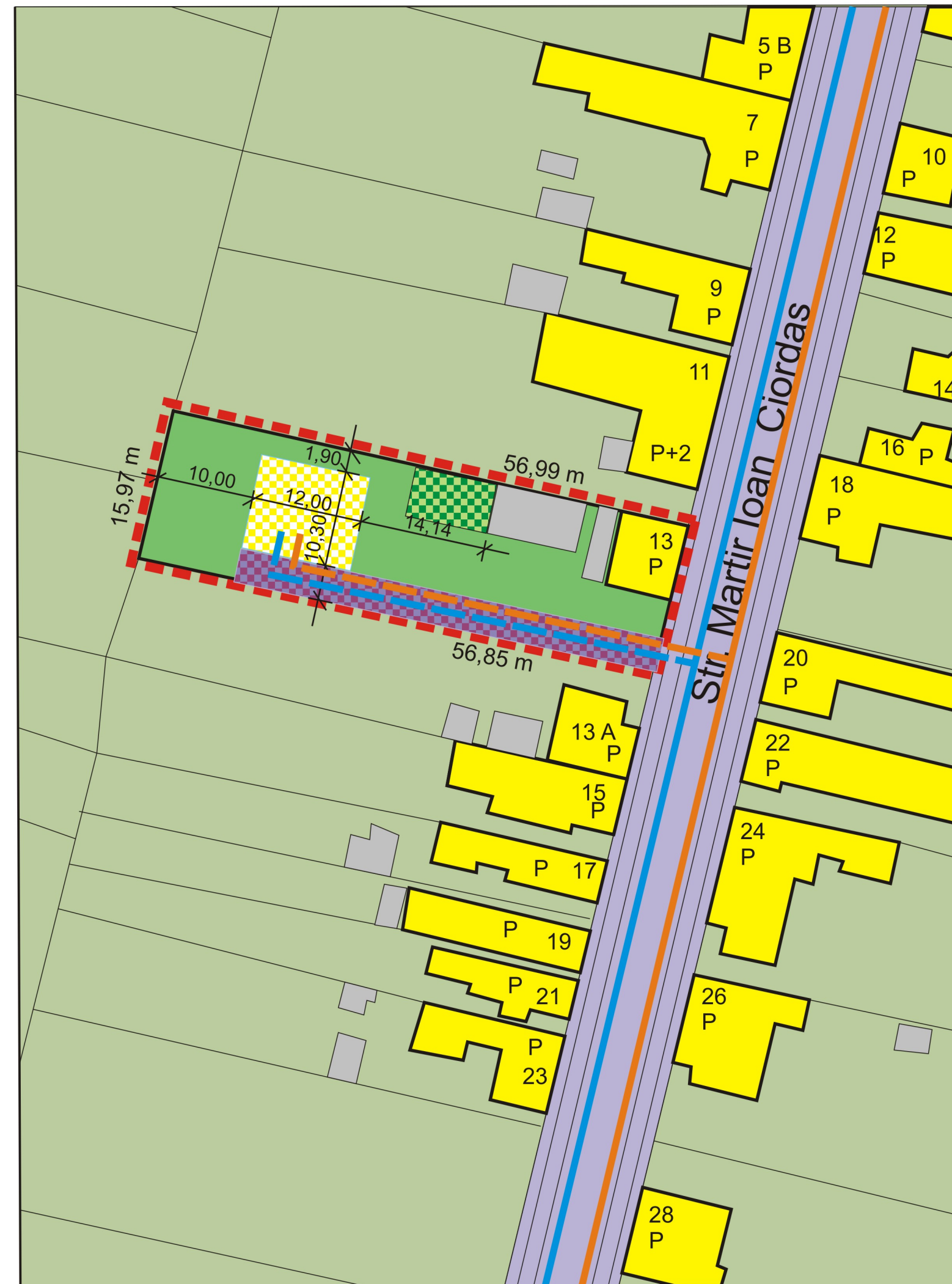
PLAN scara 1/500