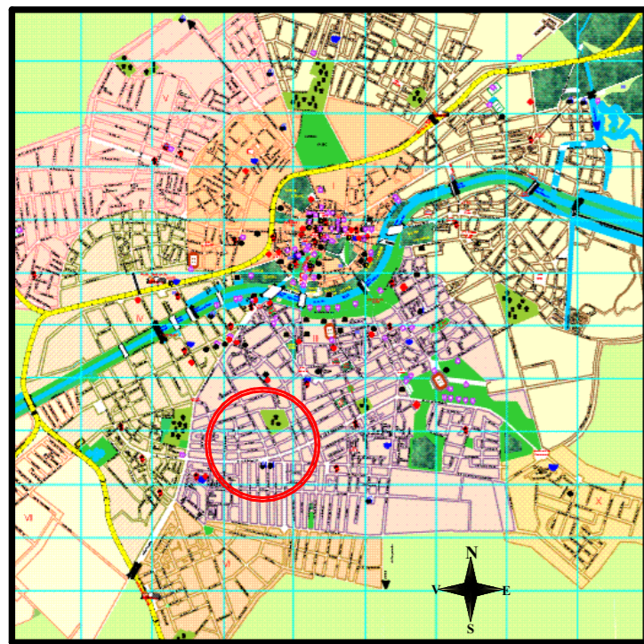
AMPLASAREA P.U.D. PE TERITORIUL MUNICIPIULUI TIMISOARA