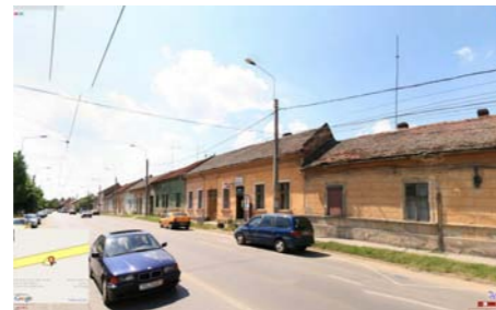
VEDERE DE PE STRADA BUDAI DELEANU