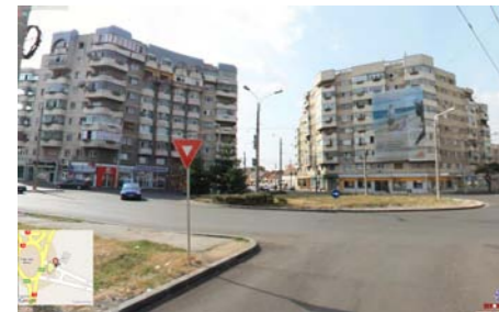
VEDERE DIN PIATA IULIU MANIU