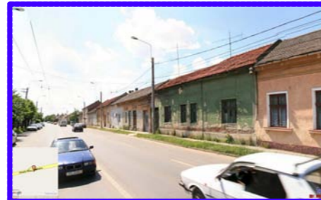
VEDERE BUDAI DELEANU NR 20