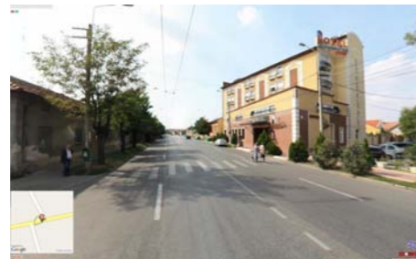
VEDERE DINSPRE HOTEL AMBASADOR