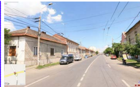
VEDERE DINSPRE STRADA CRIZANTEMELOR