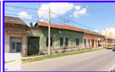
VEDERE BUDAI DELEANU NR 20