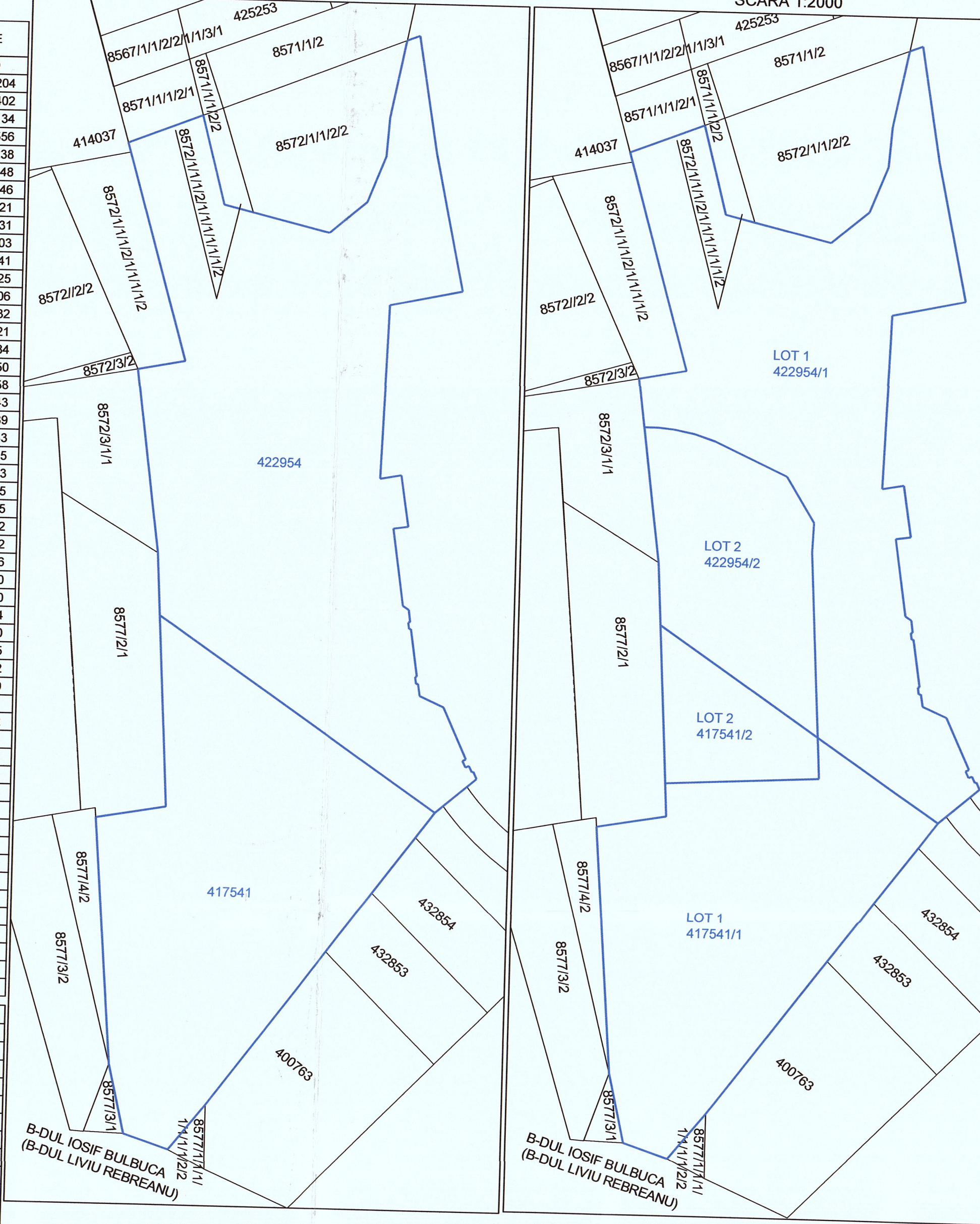
PLAN DE INCADRARE IN ZONA SCARA 1:5000