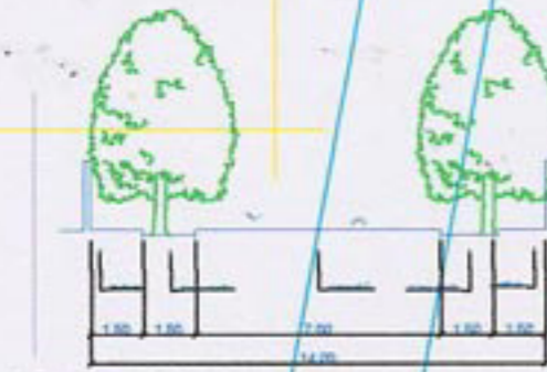
PROFIL STRADAL B-B