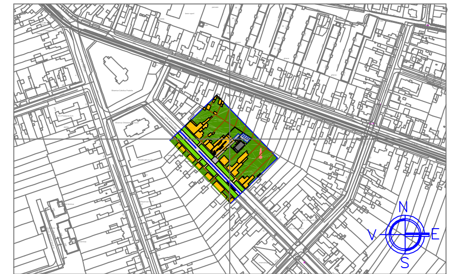
PLAN INCADRARE IN ZONA - TIMISOARA -