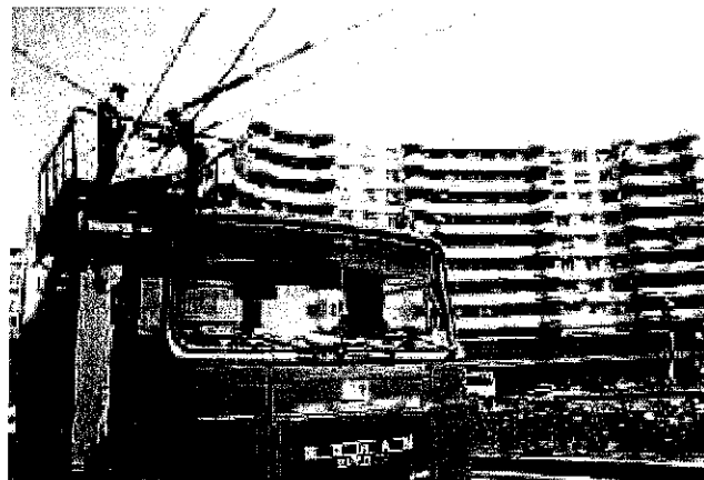
Tipuri de autoutilitare aflate în dotarea Regiei Autonome de Transport Timișoara