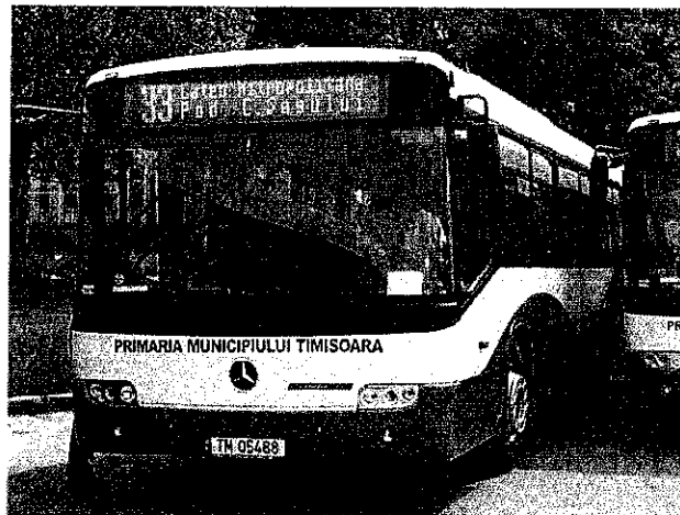
Tipuri de autobuze aflate în dotarea Regiei Autonome de Transport Timișoara