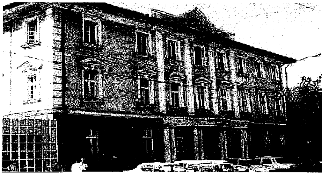
Sediu central: B-dul. Take Ionescu nr. 56, cod 300074, Timișoara, jud. Timiș. Vedere asupra sediului central.