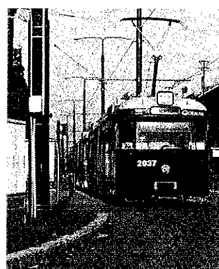
Tipuri de tramvaie aflate în dotarea Regiei Autonome de Transport Timișoara