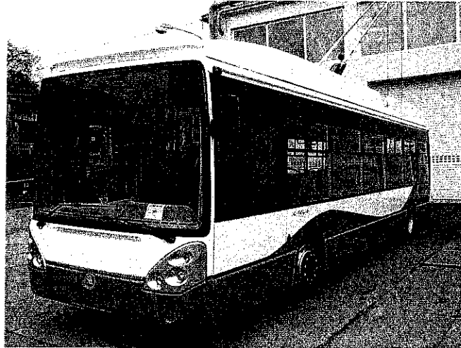
Tipuri de troleibuze aflate în dotarea Regiei Autonome de Transport Timișoara