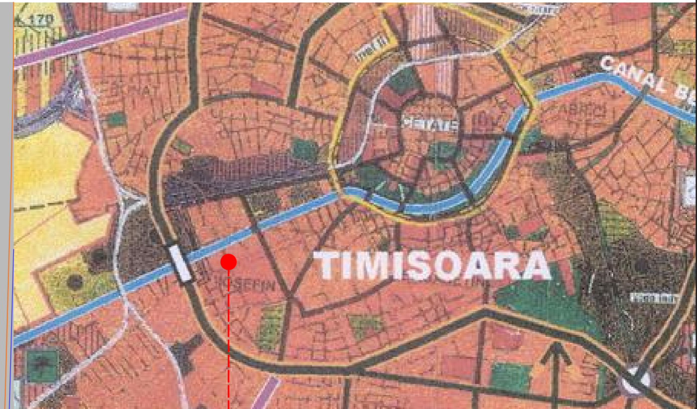
str. VULTURILOR nr. 64, TIMISOARA