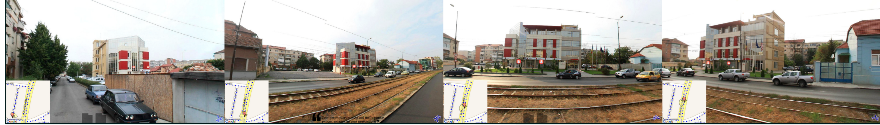
bv Cetatii - vedere de la Nord -Est