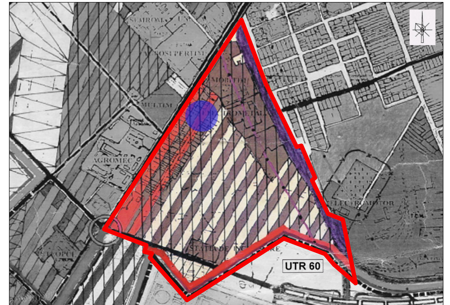
INCADRARE IN P.U.G. - UTR 60