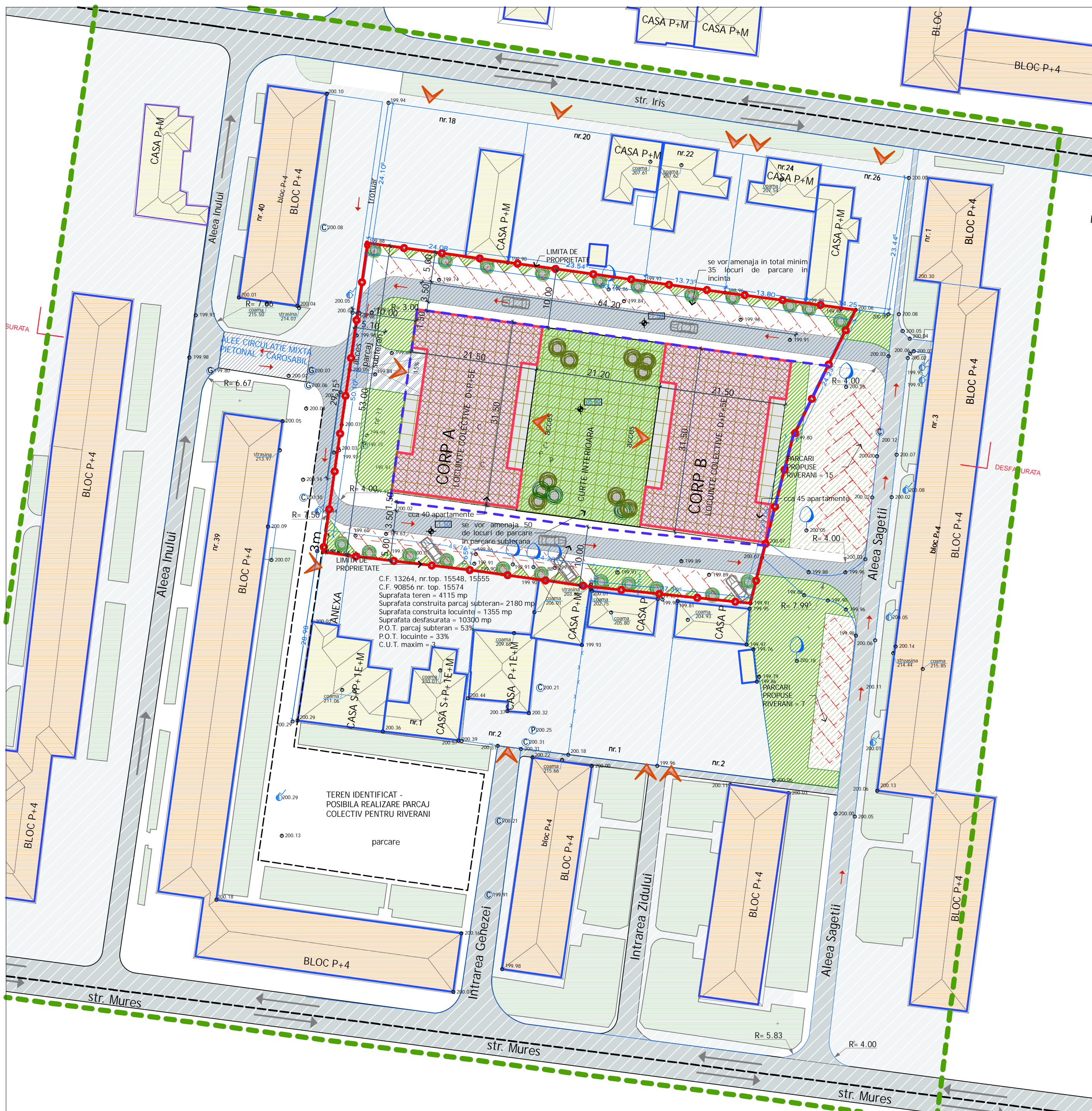
PLAN MOBILARE URBANA SC. 1:500