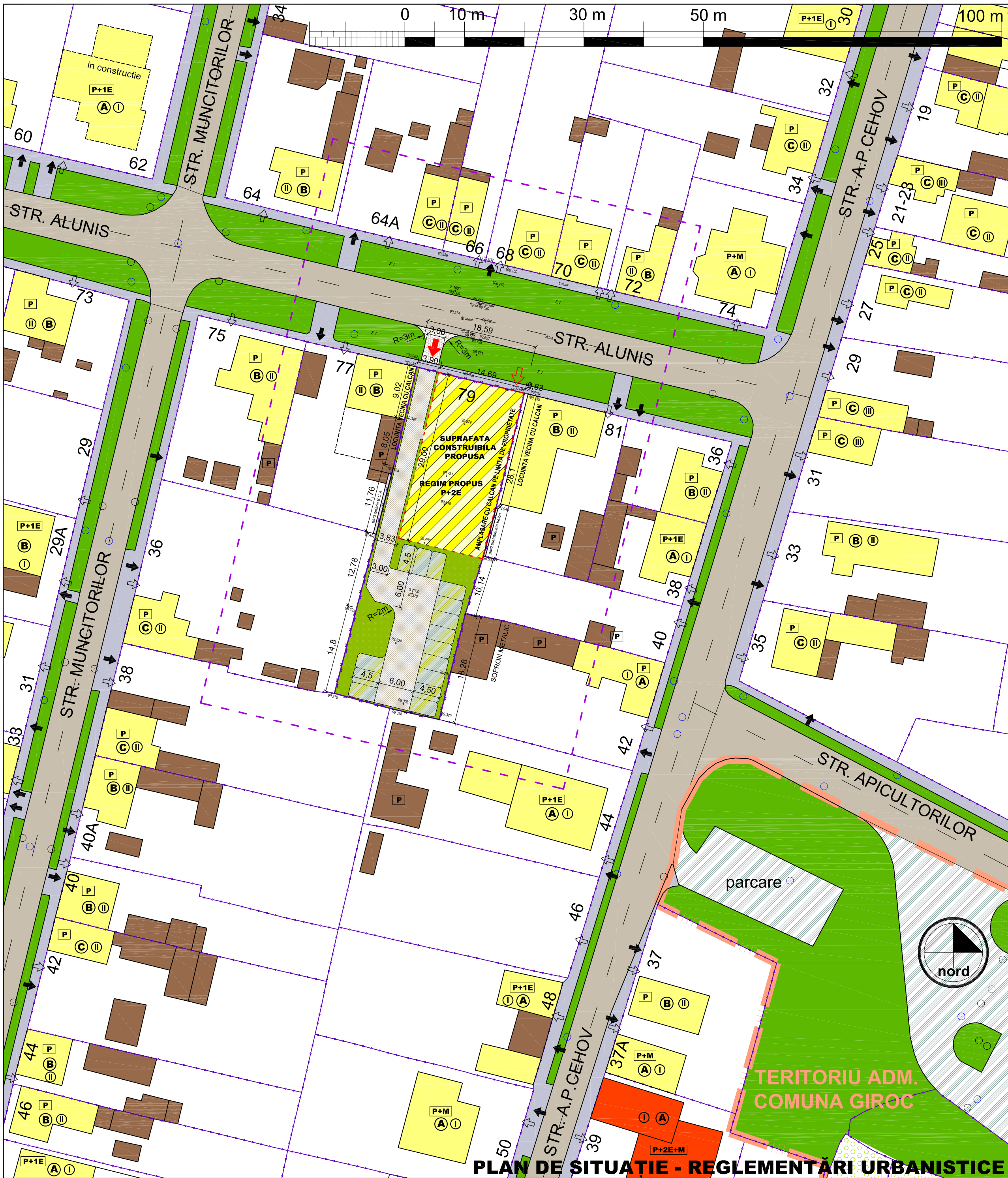
PLAN DE SITUAȚIE - REGLEMENTĂRI URBANISTICE