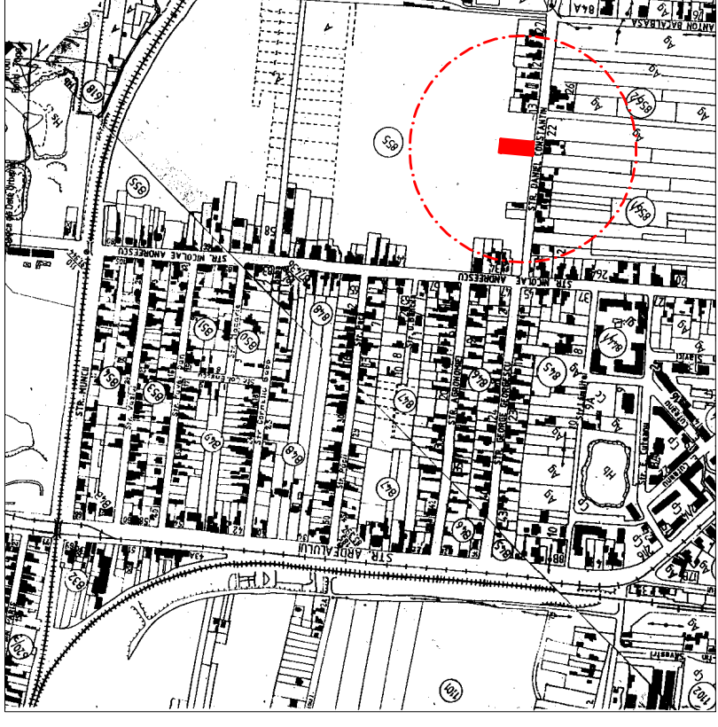
PLAN DE INCADRARE IN LOCALTATE 1:5000