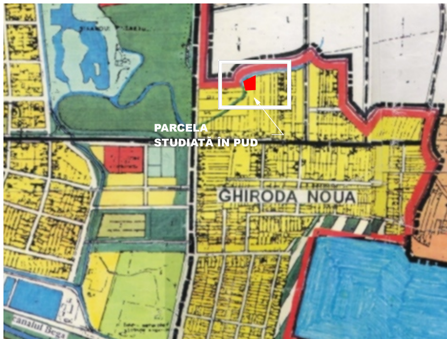
ÎNCADRARE ÎN PUG ÎN CURS DE APROBARE