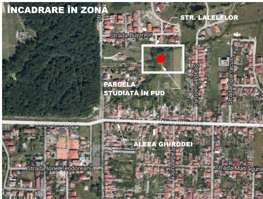
ÎNCADRARE ÎN PUG AFLAT ÎN VIGOARE