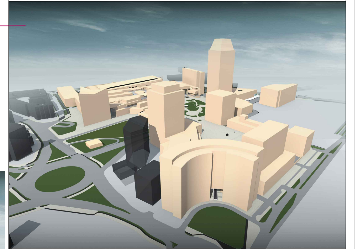
Volumetrie Calea Aradului - Str. A. Demetriade

Plan Urbanistic Zonal ZONĂ MIXTA, COMERT, SERVICII, BIROURI