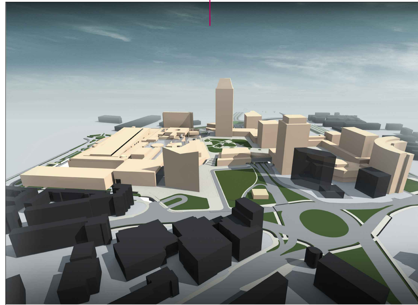
Volumetrie Calea Aradului - Calea Sever Bocu