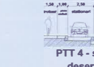
PTT 4 - s