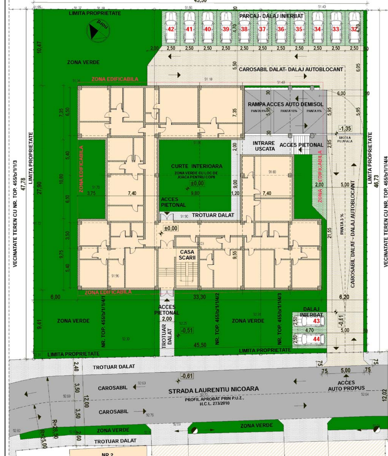
PLAN PARTER CU DISPUNEREA LOCURILOR DE PARCARE LA SOL