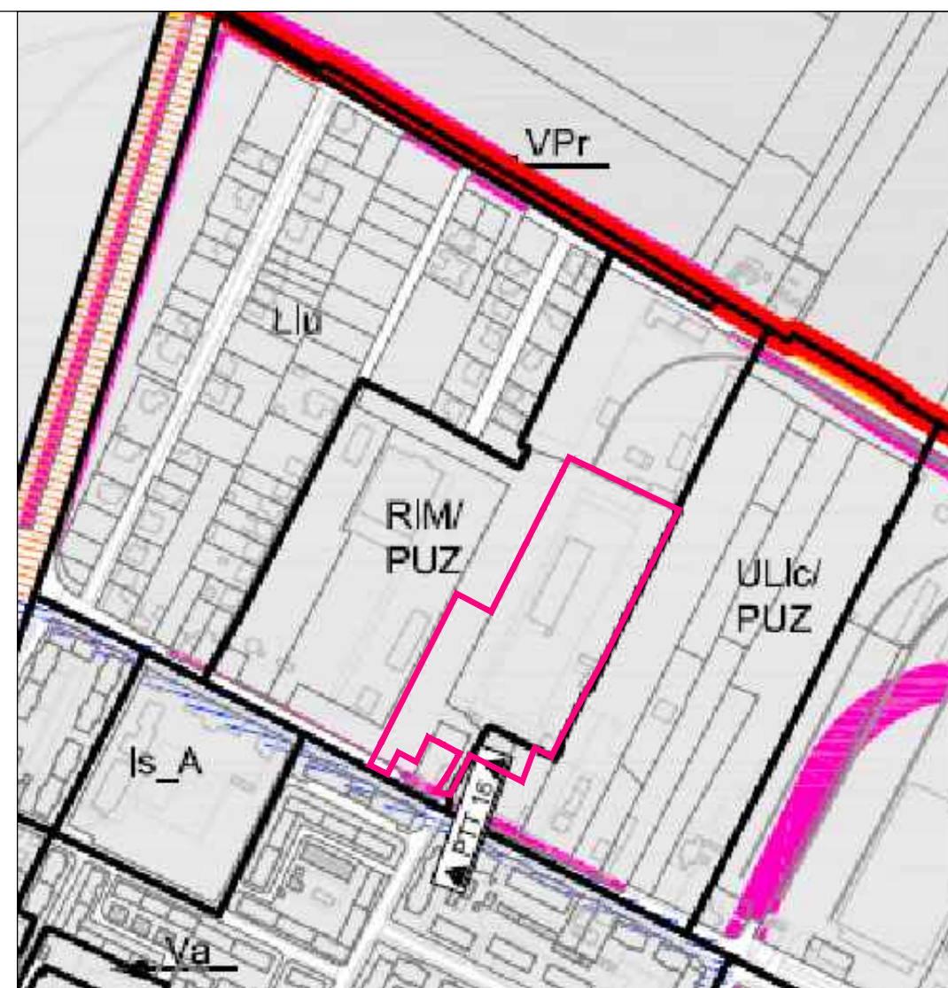
INCADRARE IN P.U.G. Etapa 3

— Limita teren P.U.Z./ Limita proprietate