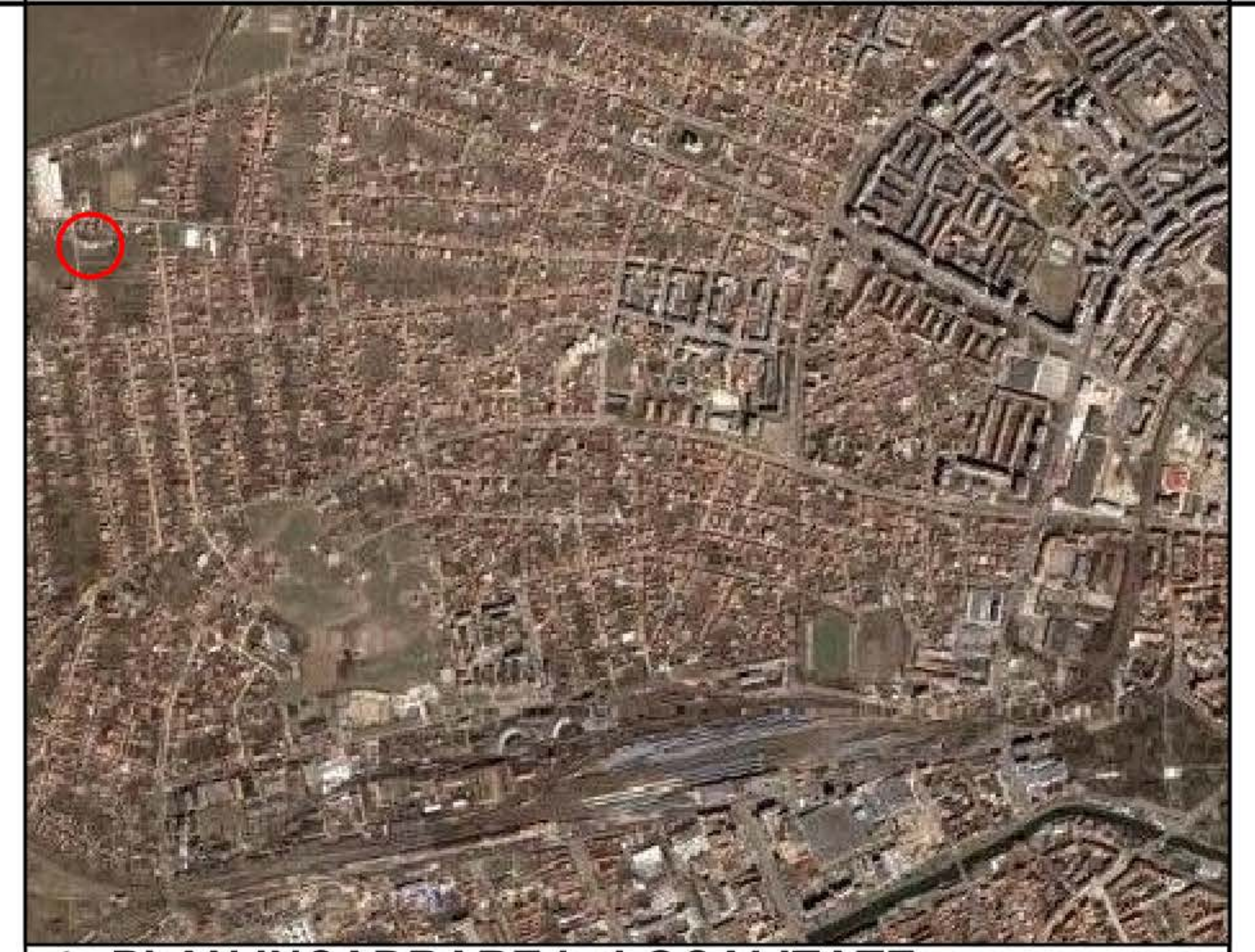
• PLAN INCADRARE in LOCALITATE