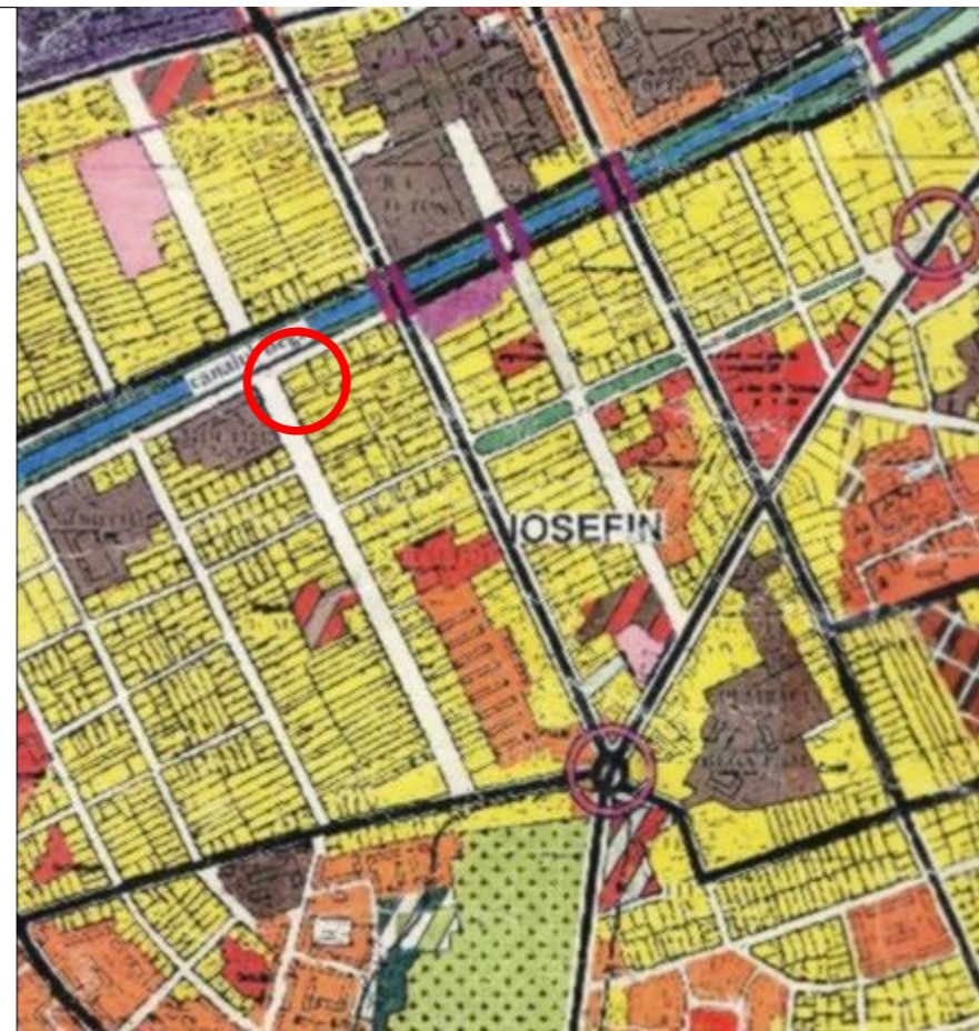
PLAN DE INCADRARE- EXTRAS P.U.G.