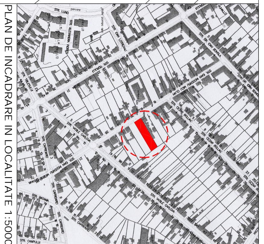
PLAN DE INCADRARE IN LOCALITATE 1:5000