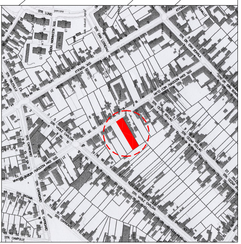
PLAN DE INCADRARE IN LOCALTATE 1:5000