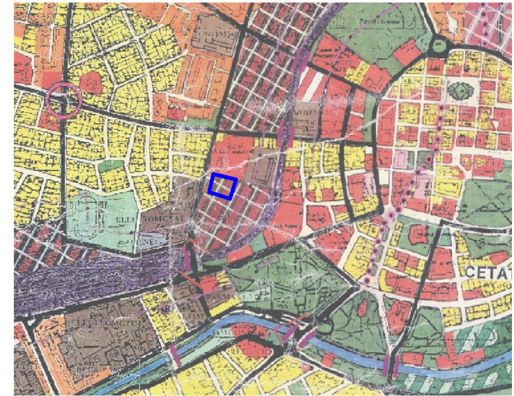
INCADRARE CONF. PLAN URBANISTIC GENERAL (P.U.G. 1998) UTR 13, INTERDICTIE TEMPORARA DE CONSTRUIRE PANALA APROBARE PUZ / SCHIMBARE DE FUNCTIUNE