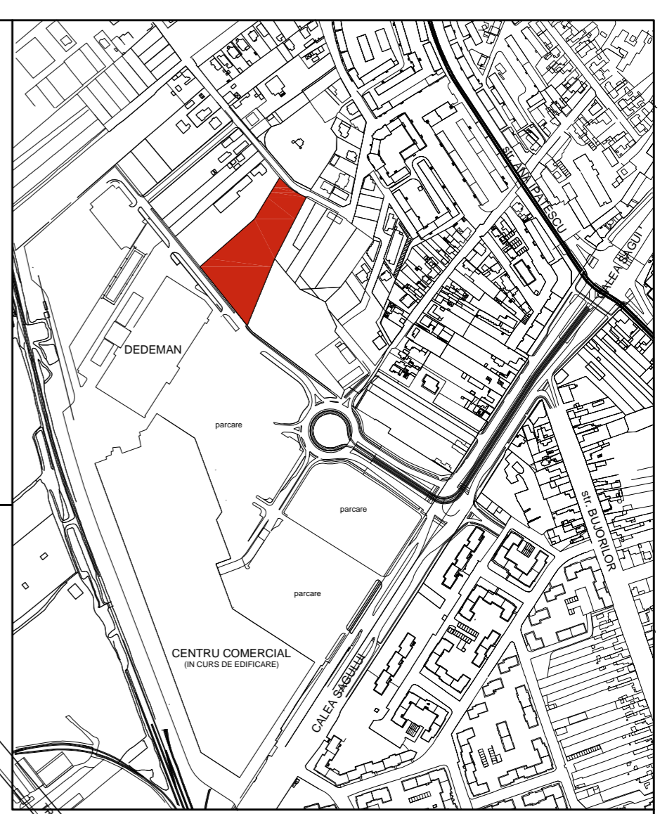
PLAN DE INCADRARE scara grafica