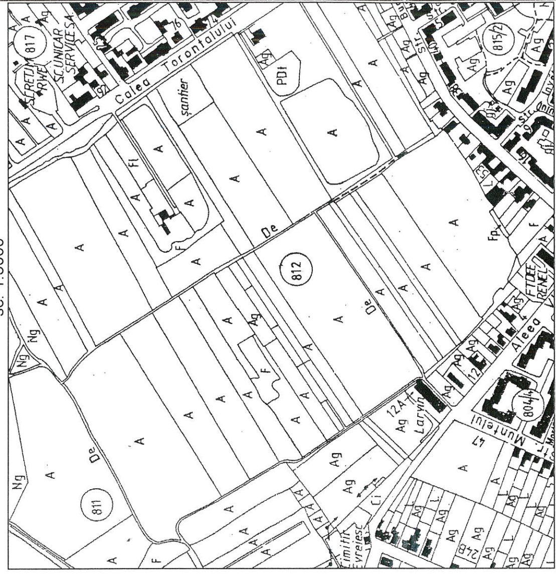
PLAN PARCELAR SC. 1:5000