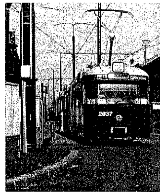
Tipuri de tramvaie aflate în dotarea Regiei Autonome de Transport Timișoara