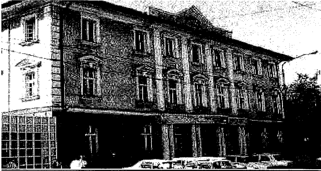
Sediu central: B-dul. Take Ionescu nr. 56, cod 300074, Timișoara, jud. Timiș. Vedere asupra sediului central.