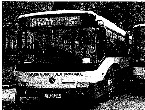
Tipuri de autobuze aflate în dotarea Regiei Autonome de Transport Timișoara