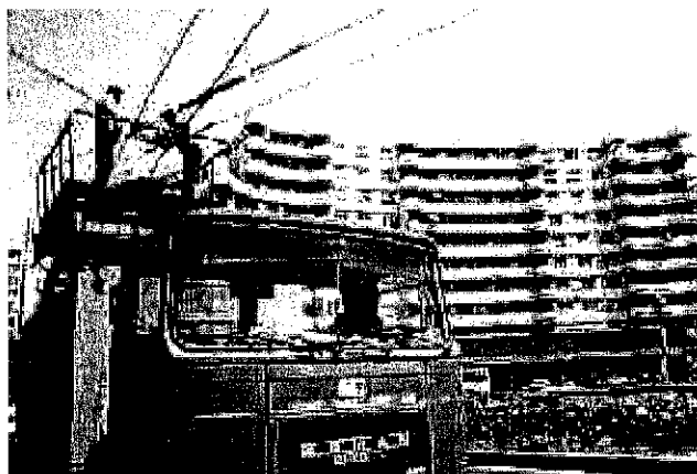
Tipuri de autoutilitare aflate în dotarea Regiei Autonome de Transport Timișoara