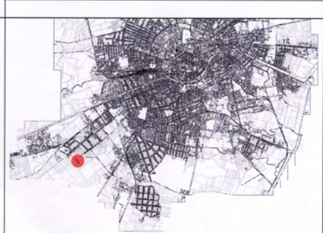
Suprafete parcele propuse

POT existent = 0% CUT existent = 0 POT propus = 50% / lot CUT propus = 0.45