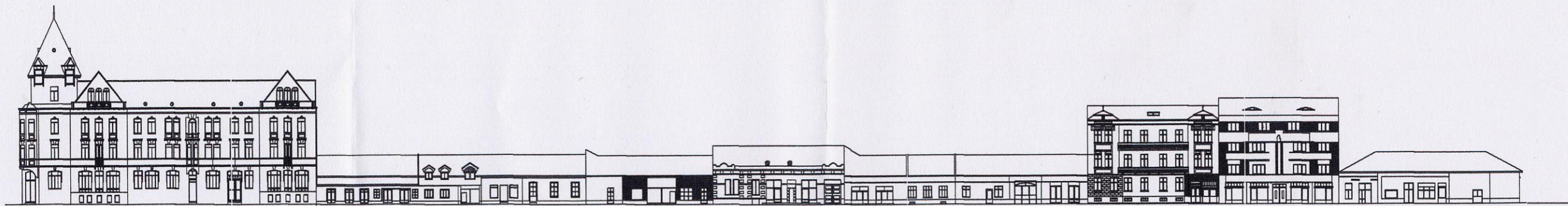
DESFAURATA STRADALA B-DUL G-RAL ION DRAGALINA SITUATIE EXISTENTA