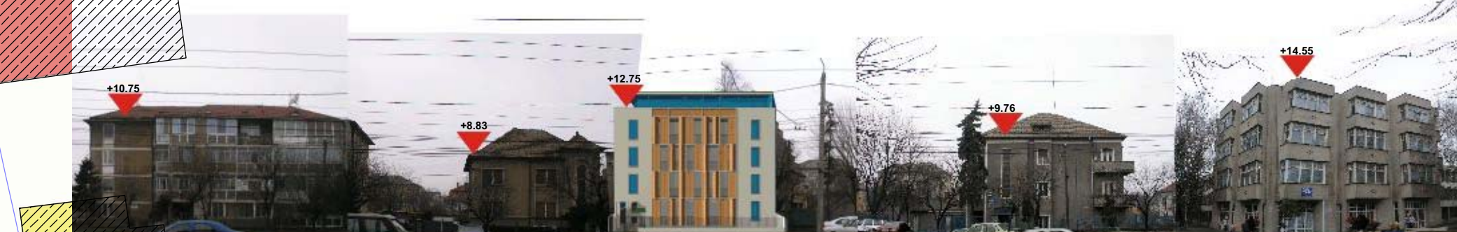
DESFASURATA STR. CLUJ PROPUȘ 1:500