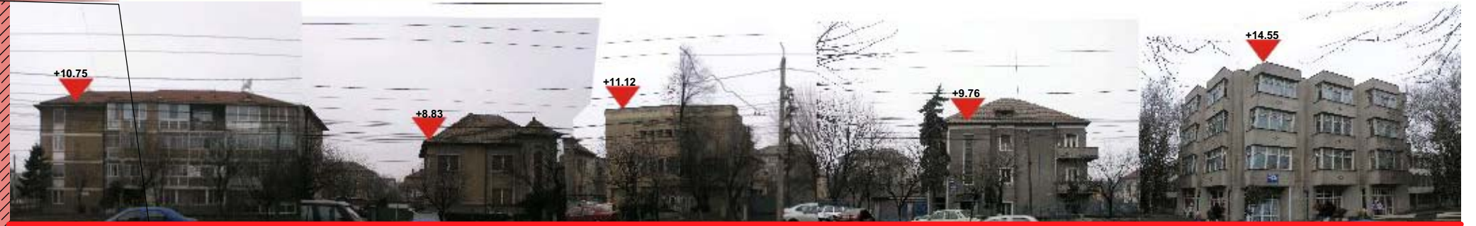
DESFASURATA STR. CLUJ EXISTENT 1:500

PRIMĂRIA MUNICIPIULUI TIMIȘOARA Serviciul Banca de Date Urbane Extras din planul de bază al municipiului ca referință pentru lucrări în continuare scara 1: 500 Data: _____